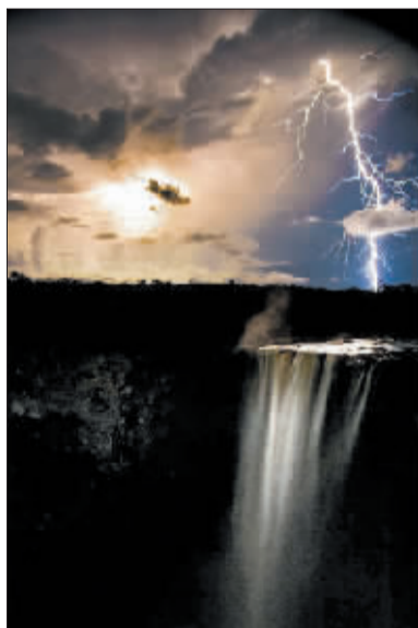
自然世界类冠军作品。夜间，一道巨大的闪电照亮了凯丘瀑布。凯丘瀑布是世界上单级落差和流量最大的瀑布。