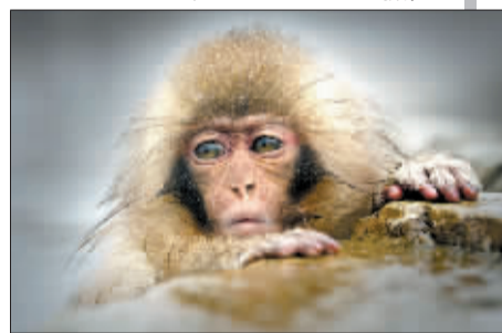
一只幼年野生日本短尾猴。