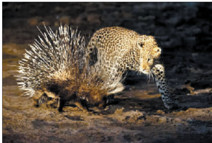
在博茨瓦纳马沙图禁猎区内，一头公豹准备攻击一头豪猪。