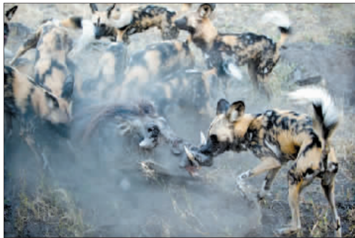
非洲博茨瓦纳北部地区，一群非洲野狗正在围攻一头非洲野猪。