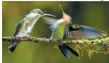
一只雌性绿顶辉蜂鸟正在向雄性绿顶辉蜂鸟吹气。