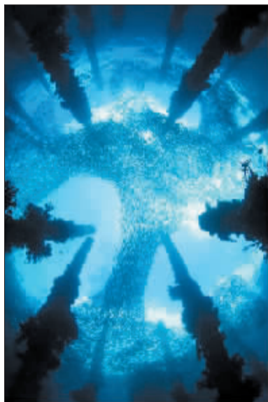
水下世界类冠军作品。大群竹荚鱼穿行于废弃码头的一根根柱桩之间，形成一幅美丽的图案。