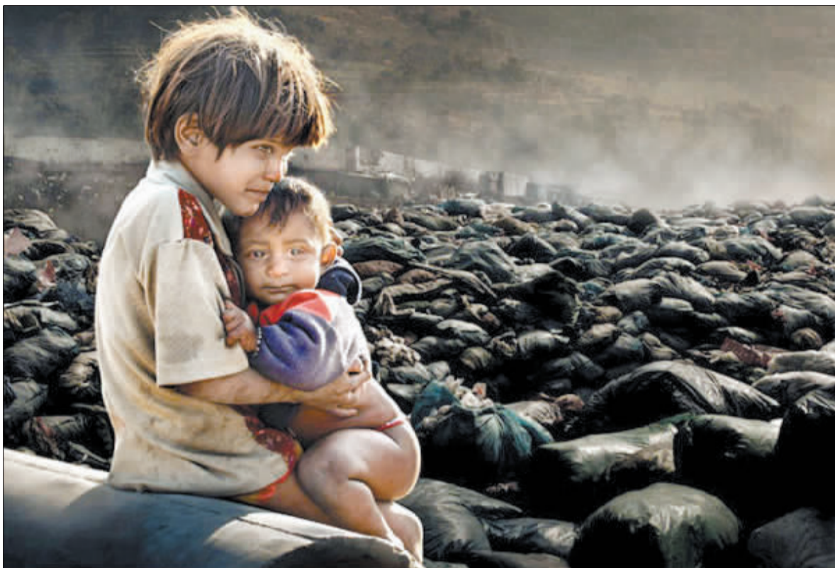
英国环境摄影师奖总冠军作品。尼泊尔首都加德满都，两个孩子与祖母相依为命，生活于一个垃圾场附近。他们每天都要到垃圾场中寻找有用的物品，然后用换来的钱购买食物。