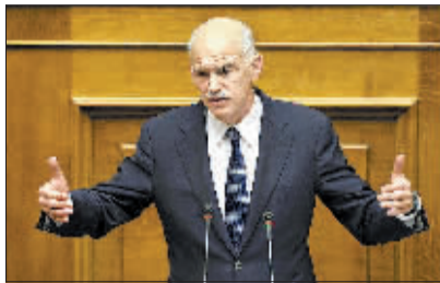
11月3日,希腊总理帕潘德里欧出席议会会议。