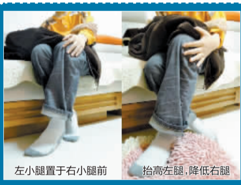
左小腿置于右小腿前