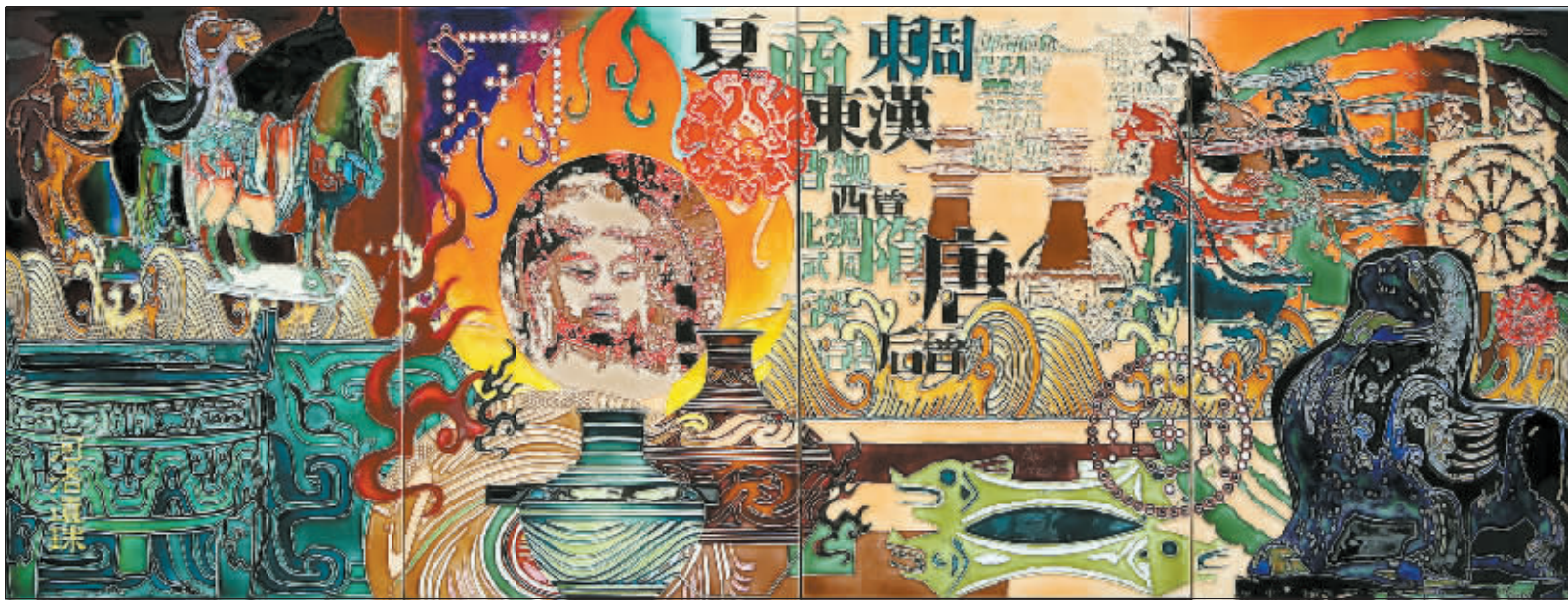
三彩釉画《河洛遗珠》