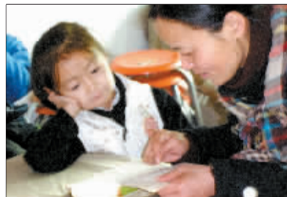
一对母女在选图书。