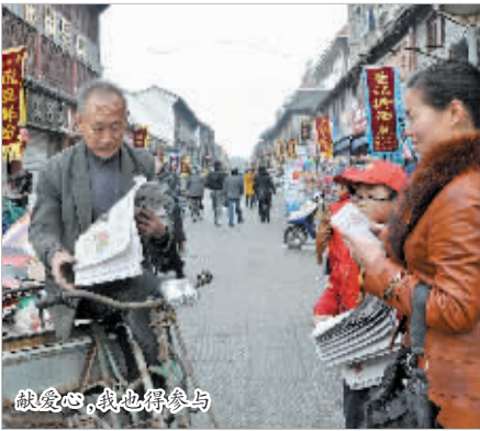
献爱心,我也得参与