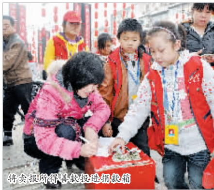
将卖报所得善款投入捐款箱