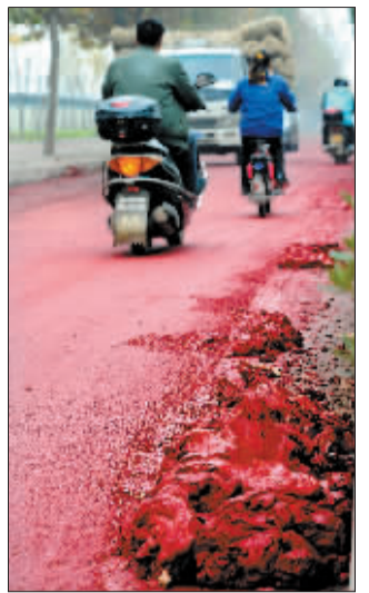
关林路与大学路交叉口处有“红泥”。