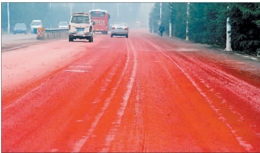
王城大道李屯特大桥段路面被染红。