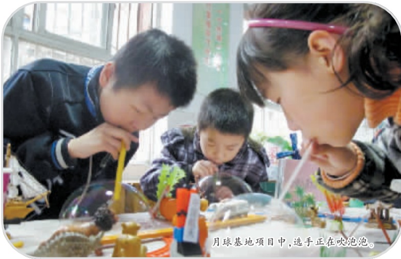
月球基地项目中，选手正在吹泡泡。

是力学上最基本的一种设计，小学生们这次的制作工艺很不错，有些甚至不亚于成年人的手工水平。比赛也让学生们意识到，平时只注重掌握书本知识是不够的，还要学有所用，自己动手创造。