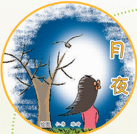
绘图 仁伟 雅琦