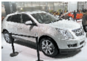
11月11日,为期五天的2011中国西南(昆明)国际汽车