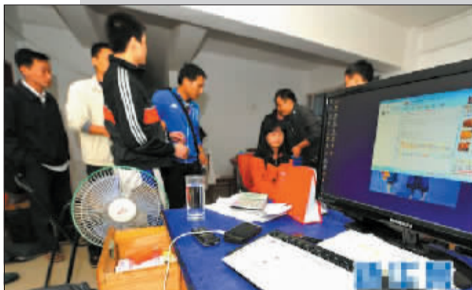
网上售假嫌犯被抓现行。

有关专家指出，加大对该类犯罪打击力度的同时，还应加强网络监管，特别是为网络交易提供平台的经营者应当切实承担起监管责任，不给网络售假提供便利；对于生产企业来说，加快转型升级、加强创新、打造自主品牌才是长久生存之道。