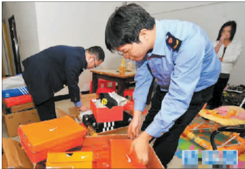
工商人员对警方查获的网售假冒“耐克”运动鞋进行清点。

近日，福建省公安机关连续破获多起网络售假案件，涉案金额上亿元。此事引发网民不小关注，人们纷纷发出疑问：在进行了不少打击后，网络售假为何依旧屡打不绝呢？