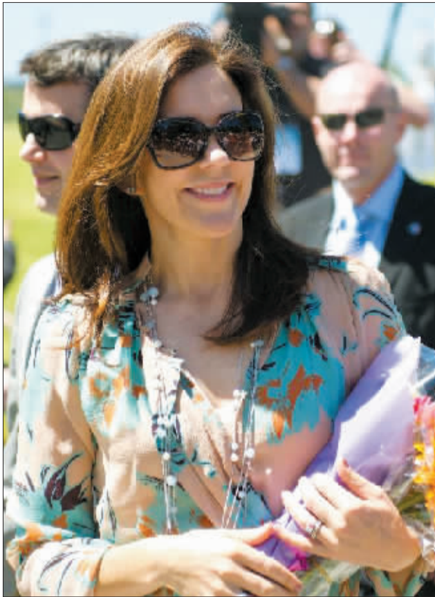
丹麦王储妃玛丽·唐纳森