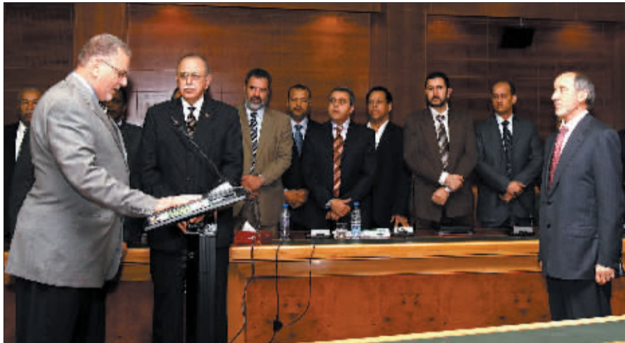
11月24日,利比亚过渡政府新任外交部长阿舒拉·本·哈耶兰(左)在首都的黎波里面对利比亚“全国过渡委员会”主席阿卜杜勒·贾利勒(右)宣誓就职。