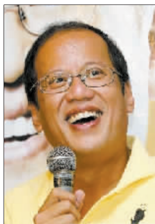
阿基诺三世 (据新华网)