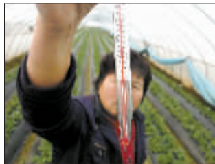
为保持大棚恒温,要不时看温度。