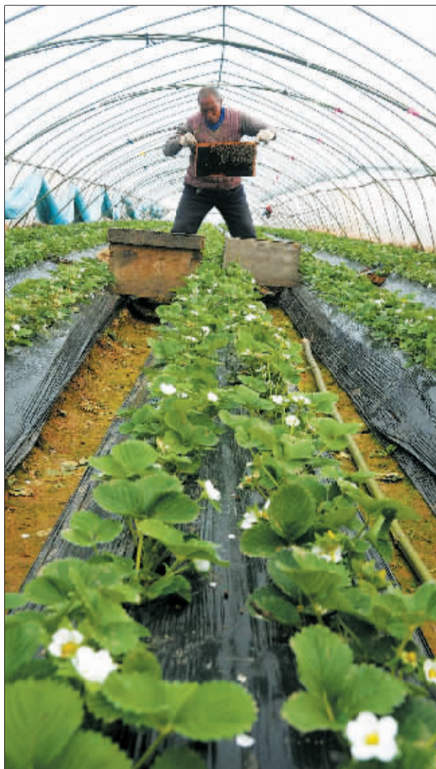
观察蜜蜂活动情况。