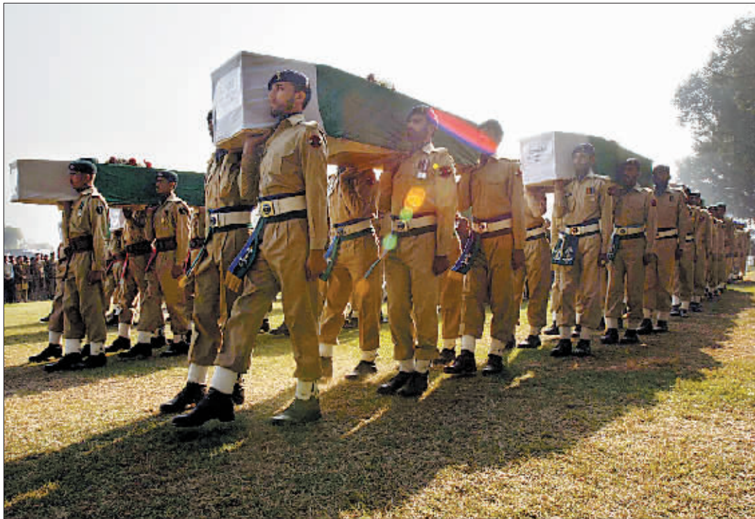
十一月二十七日,在巴基斯坦白沙瓦,巴基斯坦士兵在葬礼上搬运北约空袭遇难者的棺柩。(新华社发)