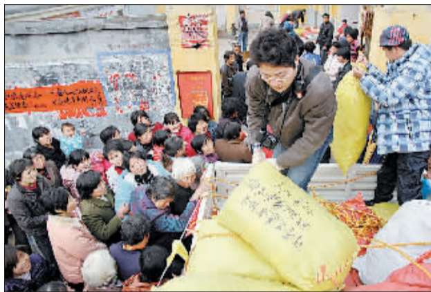
志愿者将冬衣送到黄庄乡甲庄村。