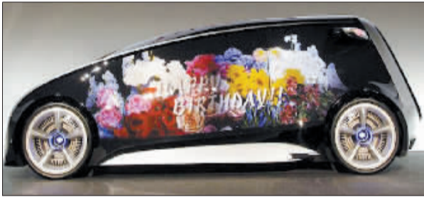
车主可以按自己的喜好改变车身的颜色和外观展示图案。