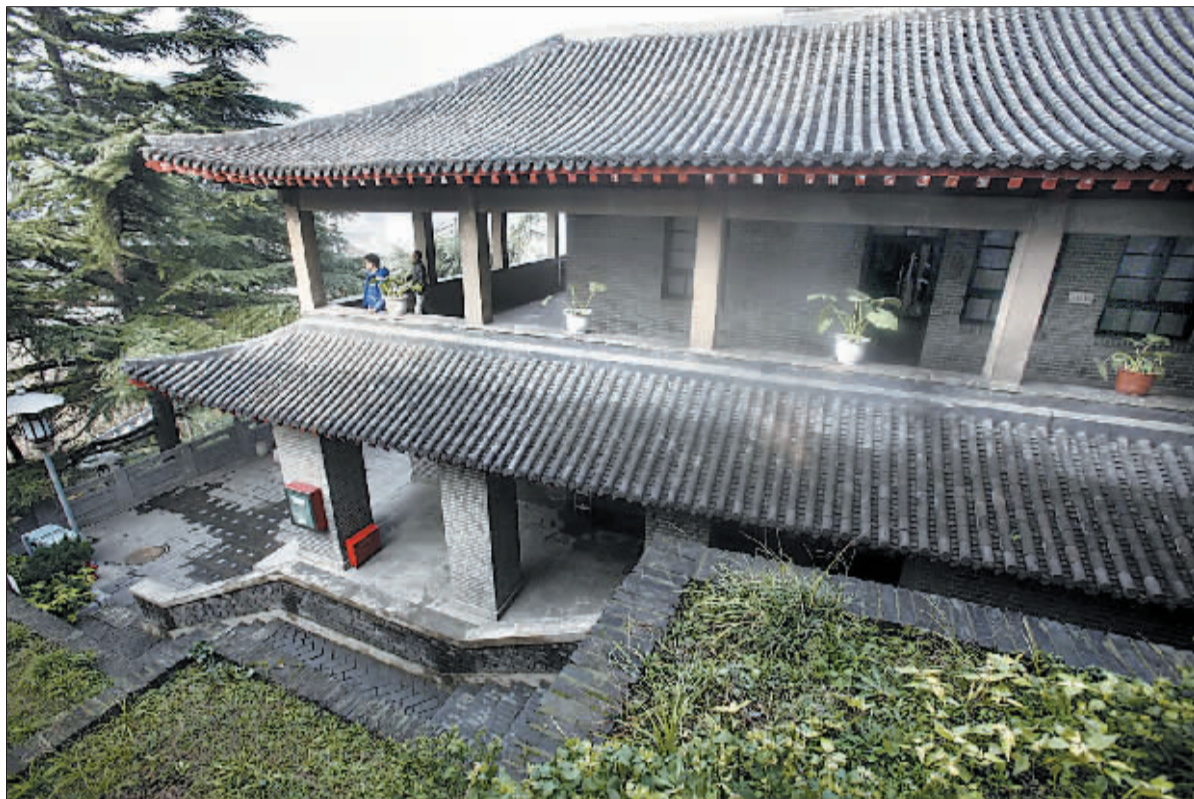
蒋宋别墅是一座清雅而古朴的二层青砖小楼。