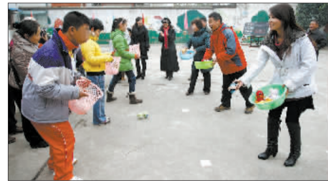
▲“娃娃回家” ▼“勇夺红旗”