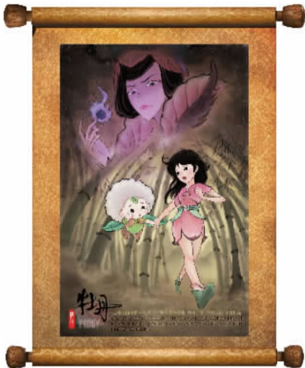
3D 动漫电影《牡丹》海报