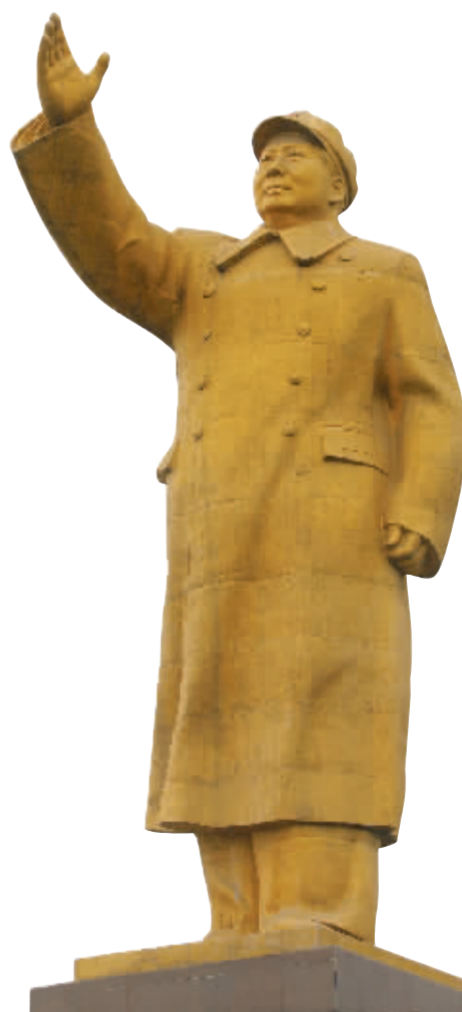
洛轴厂南毛主席塑像