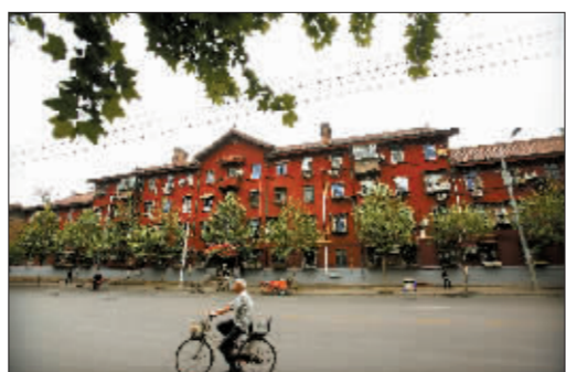
涧西区2号街坊外景