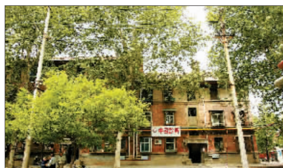
涧西区2号街坊内景