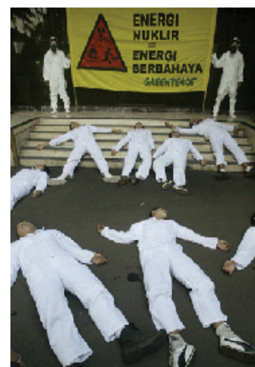
绿色和平组织支持者潜入核电站以显示其并不安全。

法国内政部发言人皮埃尔-亨利·布兰德特说:“核设施的完整性没有遭受任何威胁。”他说,9名潜入塞纳河畔诺让核电站的人员已经遭逮捕。“我们正在所有核电站和核设施展开进一步搜索。”