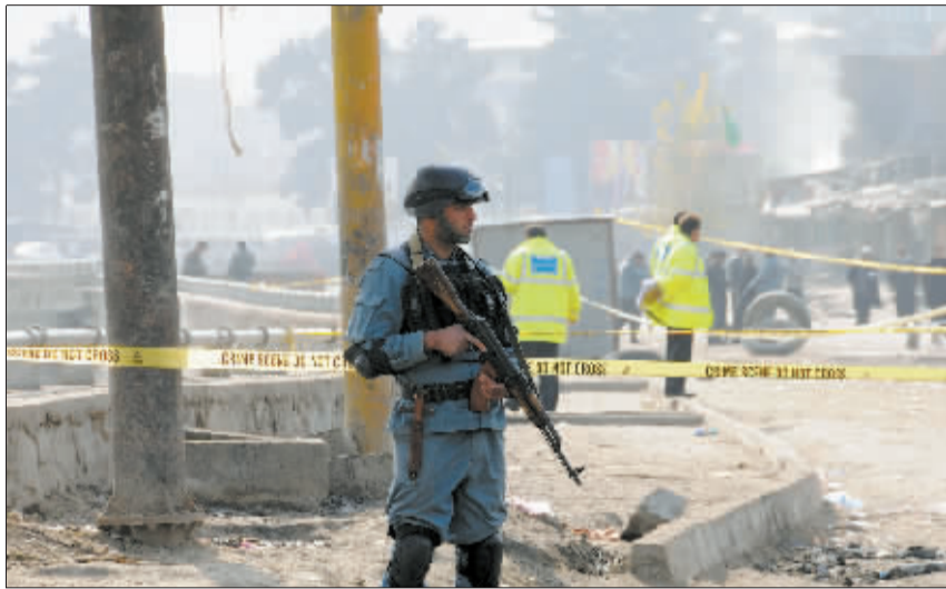
阿富汗警察在喀布尔爆炸现场附近警戒。

自今年5月1日起,阿富汗塔利班发动代号为“巴达尔”的攻势,多次袭击北约驻阿部队、阿富汗国家安全部队和阿政府高级官员。