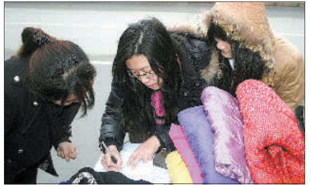
热心市民在捐赠冬衣。

今明两天, 募捐活动还在继续。市区有3个捐赠点, 分别为: 涧西区黄河路凯旋花园门口, 负责人电话: 13837988061; 西体育场星空户外, 负责人电话: 15838578882; 涧西区珠江路完美生活户外用品店, 负责人电