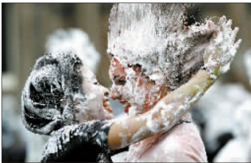
11月21日,英国圣安德鲁斯大学的学生迎来一年一度的“葡萄干星期一”,进行泡沫大战。

世界各地的传统节日形式多样,内容丰富,是世界各民族、国家悠久历史文化的有机组成部分。传统节日的形成过程,是一个民族或国家的历史文化长期积淀凝聚的过程,其中有不少节日习俗都已成为人类的非物质文化遗产。从这些流传至今的节日习俗里,我们可以清晰地看到过去人们社会生活中的精彩画面。