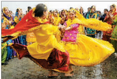
2月7日,在印度阿姆利则,身着旁遮普传统民族服装的印度女生在知识节的庆祝活动中表演。知识节是印度的传统节日,人们以此参拜知识、音乐及艺术女神莎拉斯娃蒂。