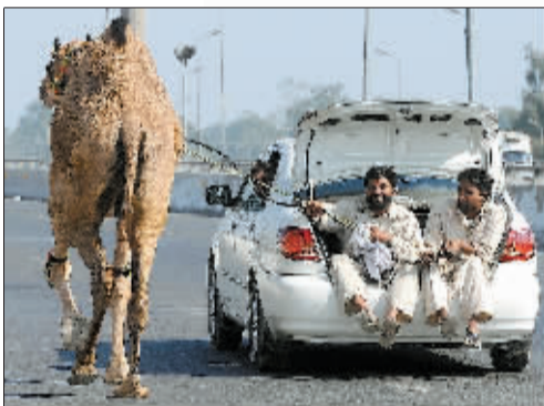
11月6日,在巴基斯坦拉合尔庆祝宰牲节期间,当地人坐在汽车后备厢中牵着刚刚从牲口市场购买的骆驼。