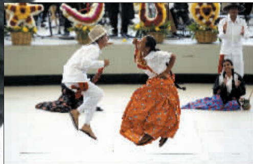
7月25日,在墨西哥瓦哈卡州,两名舞者在盖拉盖查节欢庆活动中手舞足蹈。每年7月,瓦哈卡州都会举行一年一度的盖拉盖查节,来自州内各地印第安部落推选出的各具代表性的舞蹈队在这里载歌载舞,相互交流。