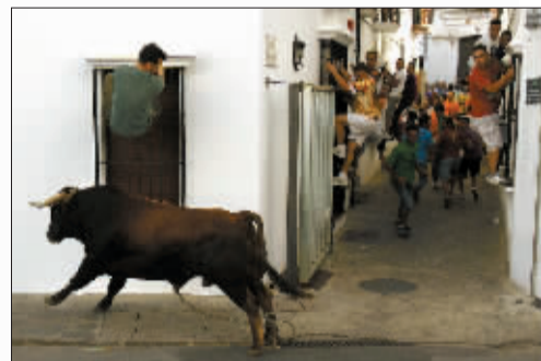
7月18日,在西班牙南部格拉萨莱马举行的绳牛节上,人们纷纷爬上门窗躲避公牛。在一年一度的绳牛节上,一头拴绳的公牛被允许在这里的大街小巷左左右撞。