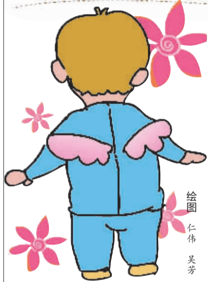
绘图 仁伟 吴芳

育儿,对于有宝宝的家庭来说,可是头等重要的事情。很多宝宝还不会说话就已经学会了看电视,然而广告也有优劣之分,那些违背育儿理念的广告,你看得出来吗?