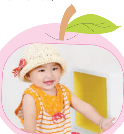
姓名:代苛珂 性别:女 生日:2010年9月3日 父母寄语:祝宝宝健康快乐成长,越长越漂亮!