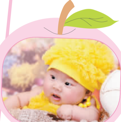
姓名:卢豫 性别:女 生日:2011年7月19日 父母寄语:愿宝贝平安健康,聪明漂亮,爸爸妈妈永远爱你!