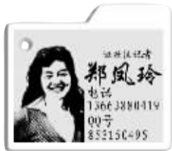
负责区域：瀍河回族区