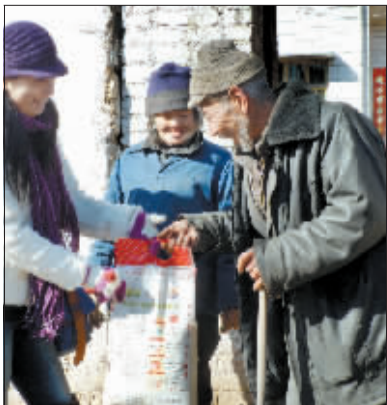
为楼上村一对老夫妇送上“爱心米”。

记者跟随其中一队前往楼上村,敲开村口一家农户的大门,一位拄着拐杖的老人和老伴儿一起从屋里慢慢走了出来,看