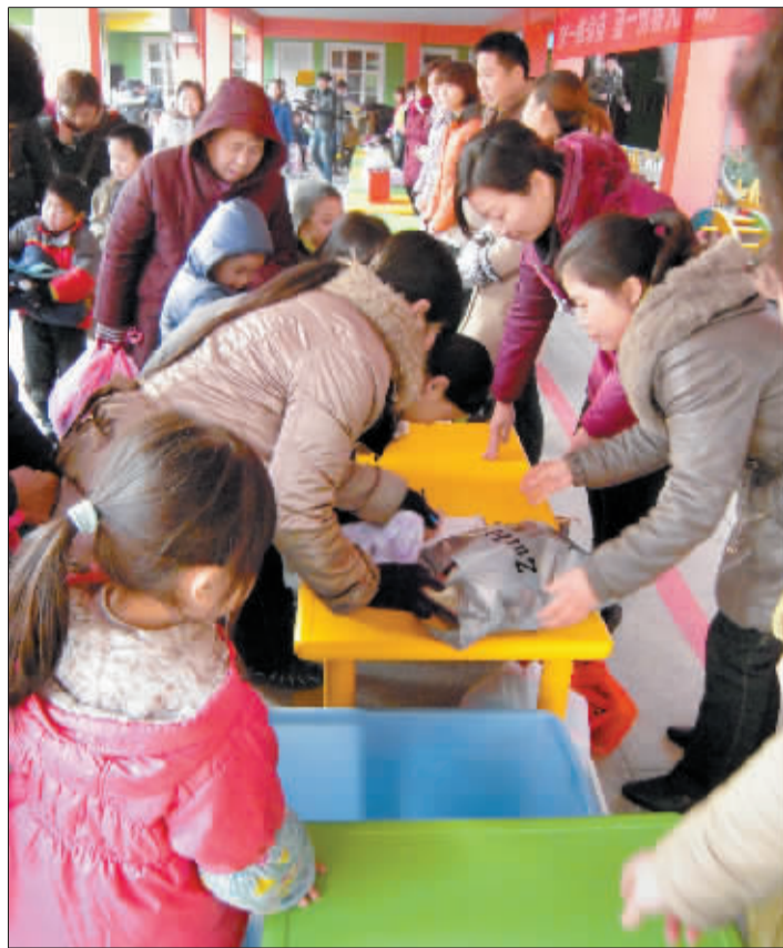
幼儿园内热火朝天的捐赠现场。

亲爱的读者朋友们,如果您了解或知道一所贫困的幼儿园,那里的孩子们需要这些爱心物品和捐款,请致电66778866告诉我们。如果您愿意组织爱心车队或加入传递爱心的队伍,来运送这些小床、凳子和冬衣,也可以与我们联系。