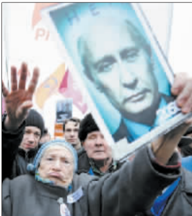
10日，莫斯科一名参加示威活动的老太太举着普京的画像。

普京领导的统一俄罗斯党则谴责反对派于选举前已设定“选举舞弊”的结果，并指社交网站已成为西方推动别国爆发革命的“新法宝”。