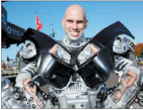
科基什也是一名《变形金刚》影迷。