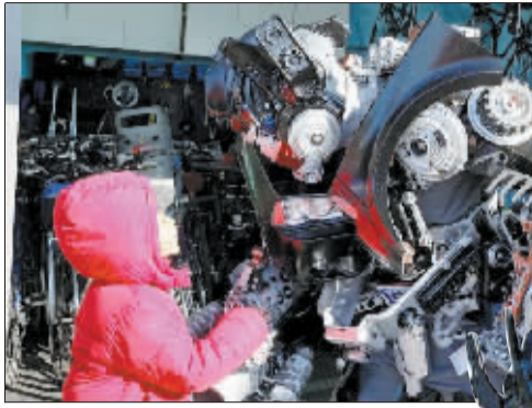
身穿盔甲的科基什与小粉丝握手。