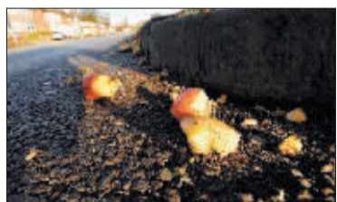
散落在路边的苹果碎块。