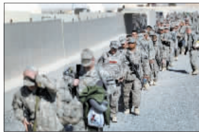
驻伊美军排队前往机场。