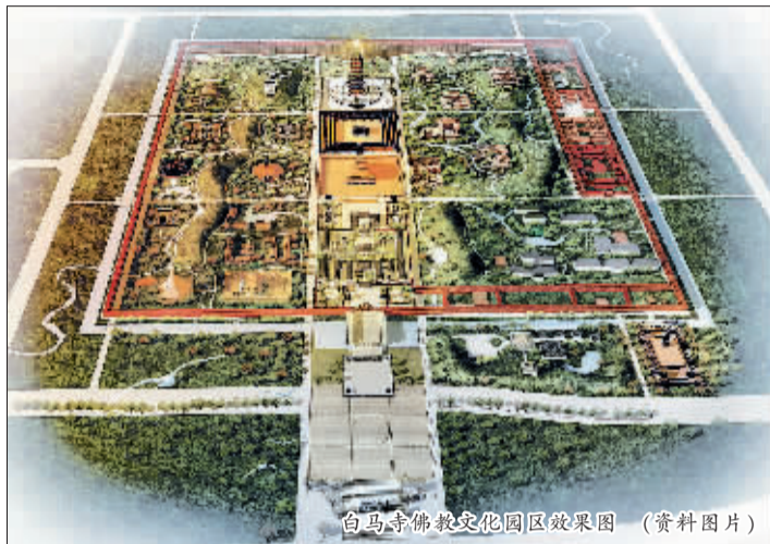
白马寺佛教文化园区效果图 (资料图片)

昨日记者从市民族宗教局获悉,白马寺佛教文化园区概念性总体规划已获得市规划委员会通过。根据规划方案,未来8年,白马寺佛教文化园区将按照“释源祖庭、佛教圣地”的总体定位,规划设计门前广场、中轴礼佛区、国际寺院区、菩萨道场区、佛学院区、综合服务区、公共服务区以及绿化隔离区等,从硬件到软件全面提升。