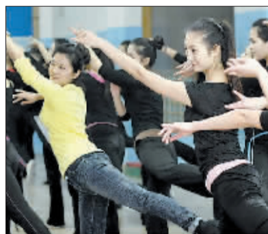
美丽背后,要付出许多不为人知的代价。