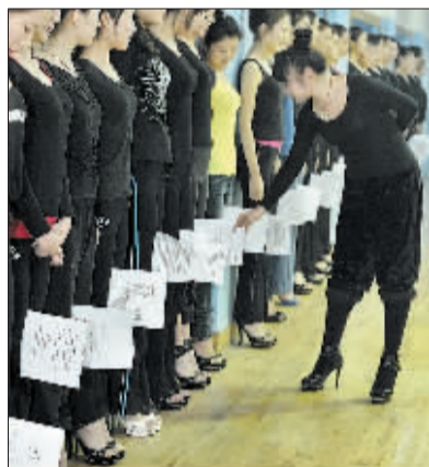
白纸掉一次,要罚做500个仰卧起坐。