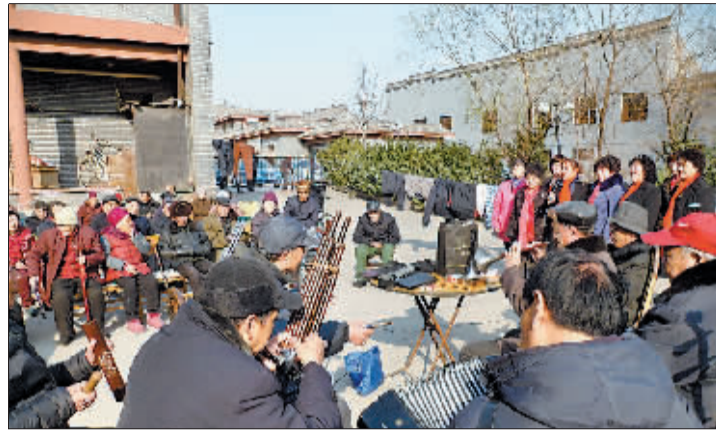
敬老院内豫剧爱好者义务为老人演出。

跟着一起打起拍子。她笑着告诉记者,虽然一直很喜欢豫剧,但自己还不会唱,这次有机会听到现场演唱,她高兴极了。