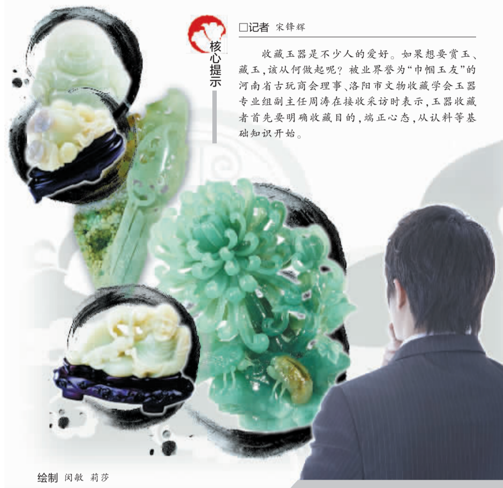
绘制 闵敏 莉莎