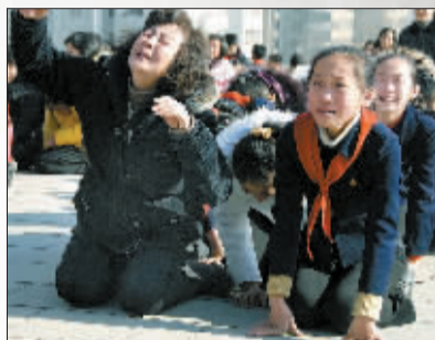
在平壤,不少市民跪地哭泣。