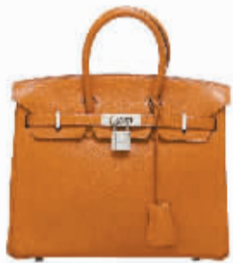
正品的爱马仕铂金包