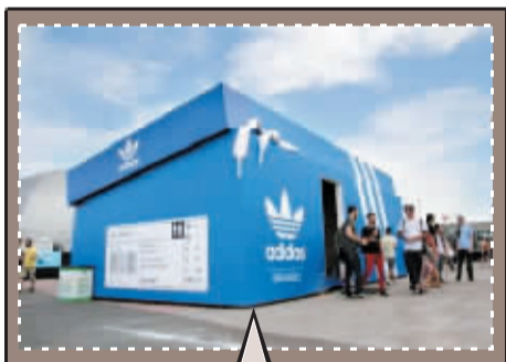
巴黎潮人:荷兰阿姆斯特丹新开了一家阿迪达斯专卖店,蓝色鞋盒的店面造型非常有创意。