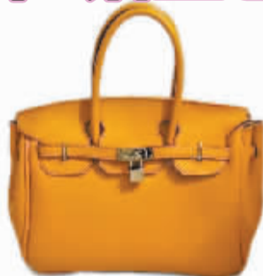
网友仿制的爱马仕铂金包

拥有一个爱马仕铂金包,是不少女网友的梦想,但是动辄十几万元的高昂价格,不得不让很多人“望包兴叹”。近日,在天涯论坛,一名DIY(Do it yourself,自己动手做)达人仿照爱马仕铂金包的样式手工缝制了一款包,其考究的做工、精致的细节足以以假乱真,引来近十万名网友围观。