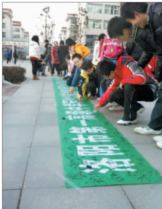
学生们为山区孩子写下心中祝福。