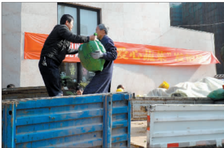
在爱心蔬菜发放现场忙碌的工作人员。