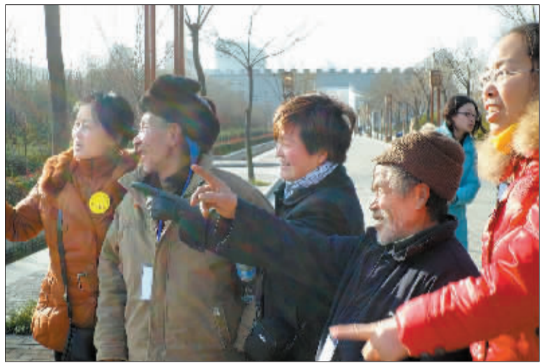
义工在为山区老人讲解。

24日上午,美丽的洛阳市区迎来了50名特别的客人,他们来自嵩县大坪乡,虽然都已过了花甲之年,但其中很多老人都是头一次来到洛阳市区,有的则是这辈子第一次走出世代居住的村庄,看着高楼林立的洛阳城,不少老人笑着感慨:我要是住在这儿啊,一定摸不着东西南北!