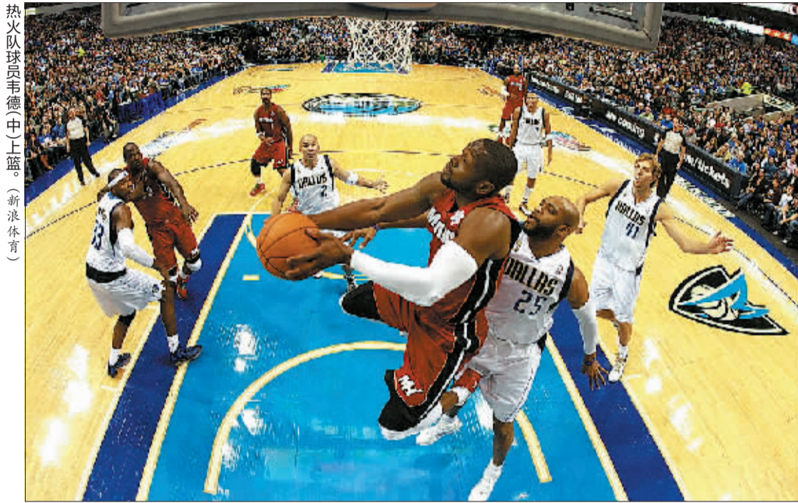
热火队球员韦德(中)上篮。