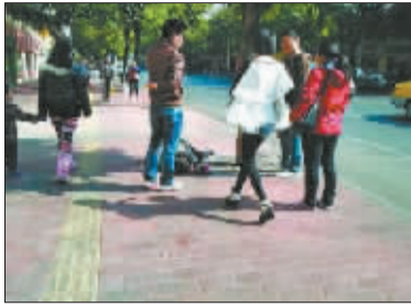
1 少女走向晕倒妇女。