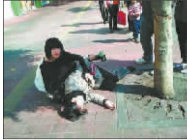
2 面对路人有点无助。