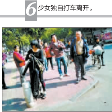
6 少女独自打车离开。