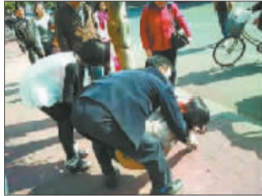
3 无奈叫来司机帮忙。