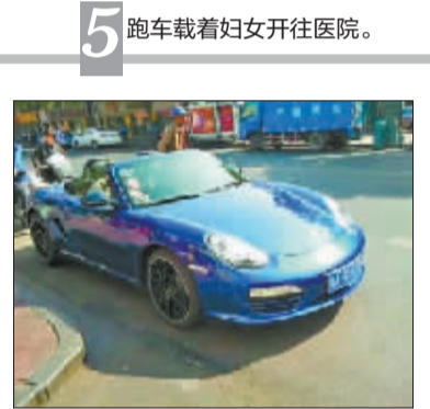
5 跑车载着妇女开往医院。