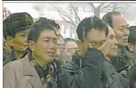
朝鲜民众在平壤参加朝鲜最高领导人金正日遗体告别仪式时恸哭。