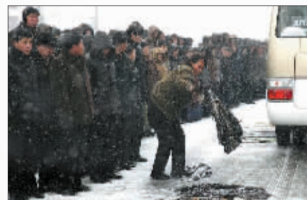
民众用衣物遮盖道路，防止车辆通过时打滑。