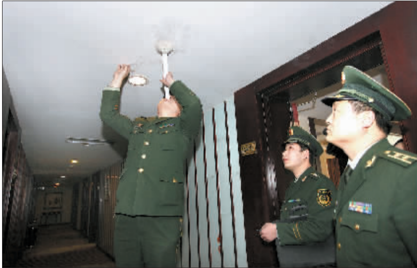
消防检查人员正在对烟感探头进行吹烟测试。