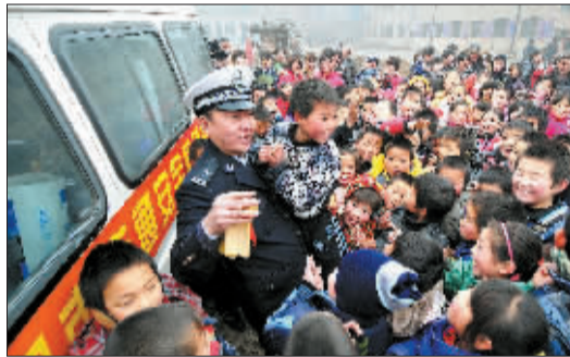
宣讲团成员用快板向学生宣讲交通安全常识。