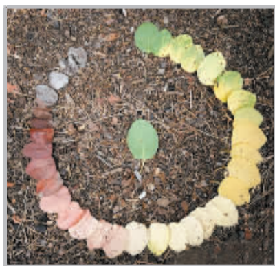
灵思：生命的循环，摄影师用叶子诠释生命。