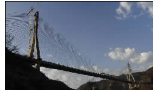
巴鲁阿特桥横跨峡谷。