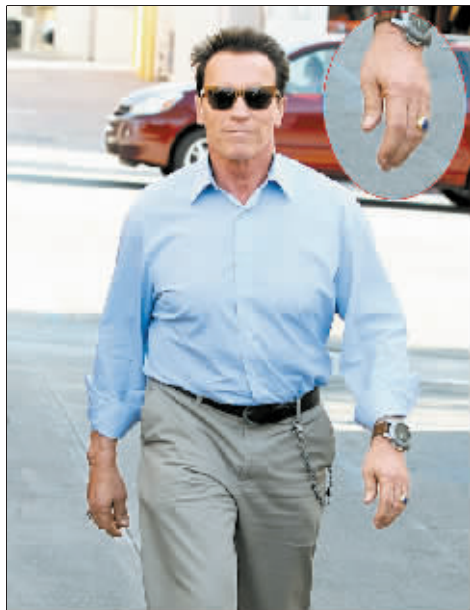
重新戴上婚戒的施瓦辛格。