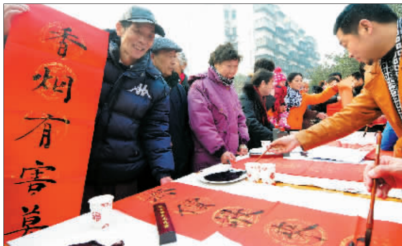
书法家现场为社区居民写春联。