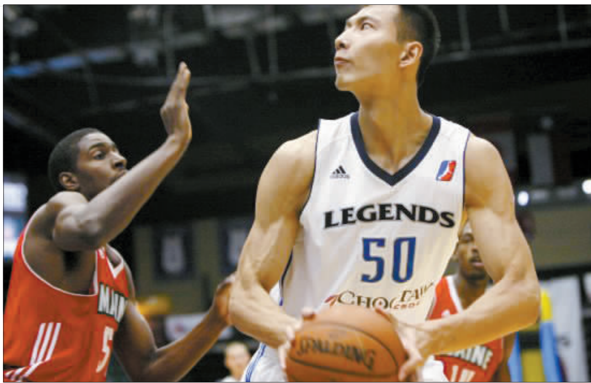
易建联(右)在发展联盟的比赛中进攻。