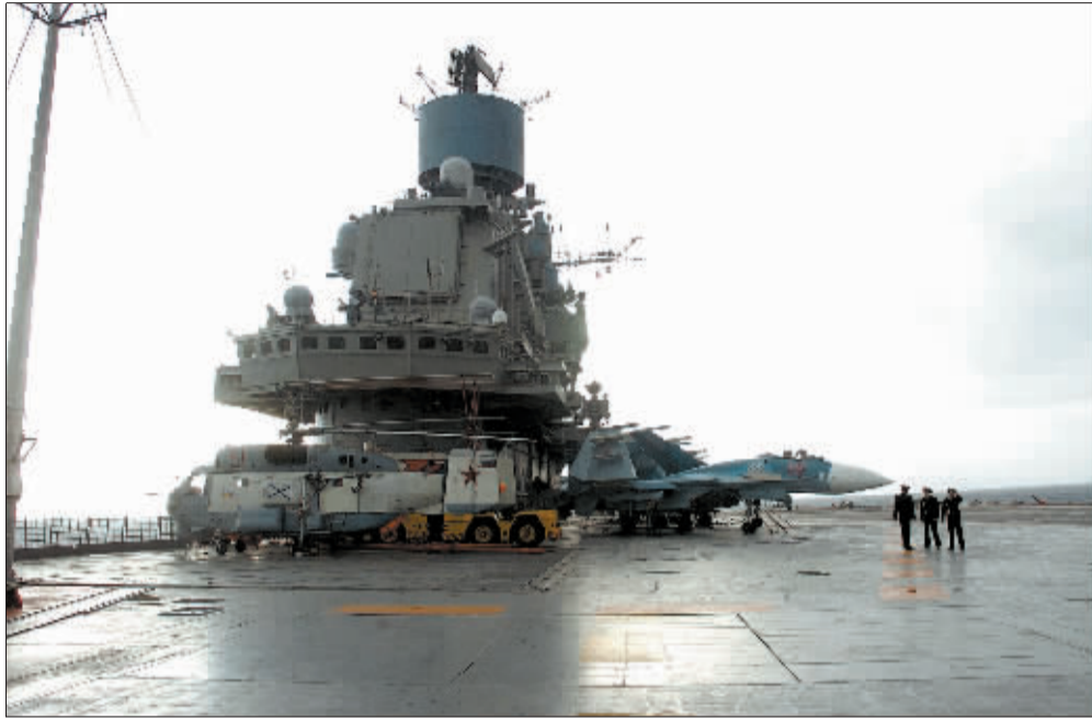
1月8日,俄罗斯“库兹涅佐夫”号航空母舰停泊在叙利亚塔尔图斯港口。

综合外国媒体报道,俄罗斯海军舰艇编队1月8日驶入叙利亚塔尔图斯港,叙媒体称此举是为了“展现同叙利亚人民的团结”。同一天,阿拉伯国家联盟(阿盟)部长级委员会在埃及首都开罗召开会议,决定继续执行阿盟在叙利亚的观察任务,加强同联合国的合作以获得更多的技术支持。