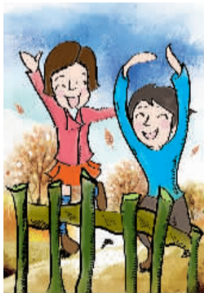
本版绘图 玉明 雅琦

人的一生可分为好几个章节,各有不同的主旋律,无法互相替代。儿时的游戏生活已经不复存在,把握短暂却充满拼搏的流金岁月才算无愧于人生。活在回忆里,只有伤感与幻想;活在奋斗中,才是真实生活。我深深地回望一眼那熟悉的绿色栅栏,带着美好回忆去开辟新天地。 (洛阳新区 焦亦飞)