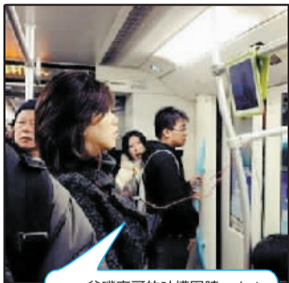
贫嘴亮哥的吐槽围脖:在地铁里正确使用iPad的方法。